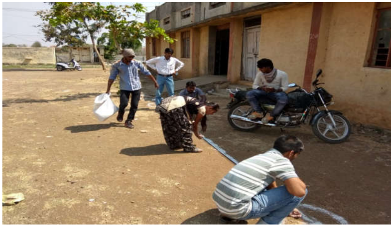
(कमवा आणि शिका चे विद्यार्थी झाडांची आखणी करीत असतांना)