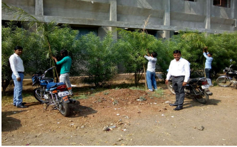
(कमवा आणि शिकवा विद्यार्थी नेमुन दिलेले कामे करतांना)